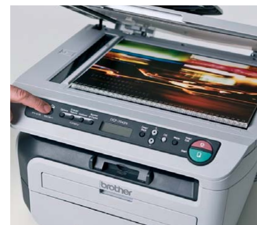
Висококачествено едно- и многоцветно сканиране