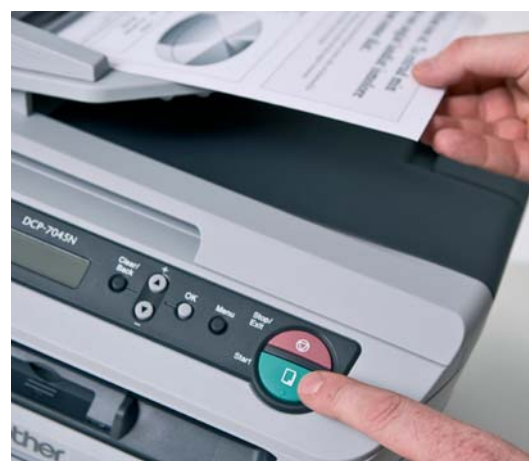
Автоматично листоподаващо устройство (ADF) – идеално при копиране или сканиране на документи от няколко страници. (DCP-7045N)

Посетете http://solutions.brother.com за повече информация.