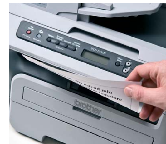
Бърз и висококачествен едноцветен печат.